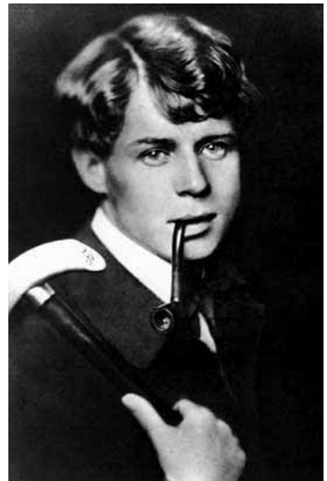
Фото-документальная и книжная выставки «Жизнь и творчество С.Есенина»

Музыкально-литературный вечер, посвященный С. Есенину (зал П. И. Чайковского, РЦНК, Валлетта) Весь месяц